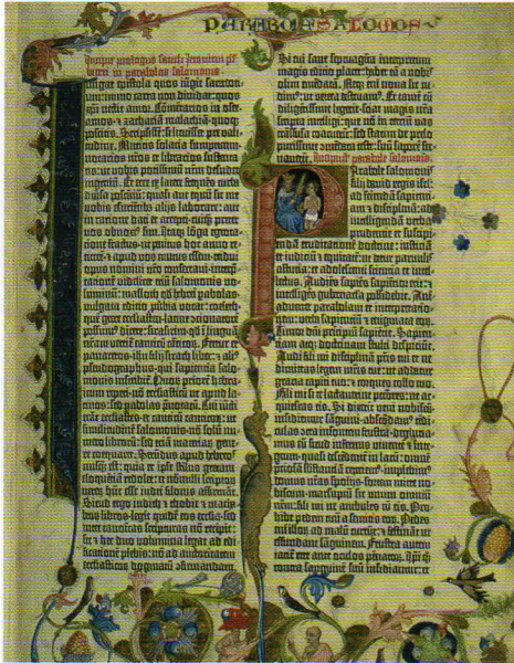
Première page de la Bible à 42 lignes, vers 1455.

Cette page a été imprimée sur du parchemin. Mais, au fil des années, on utilise de plus en plus une nouvelle matière beaucoup moins chère : le papier.