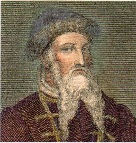
Gravure, XVI e siècle.

Gutenberg est un artisan allemand du XV e siècle. Vers 1450, il invente une machine permettant de reproduire des textes. C'est l'imprimerie.